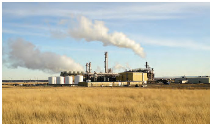
梅赛尼斯公司位于加拿大艾伯塔省（Alberta）药帽城（Medicine Hat）的甲醇生产厂

我们成功完成了这些大检修，在新冠疫情期间，这需要大大加强安全保障措施和操作规程，体现了公司与承包商和合作伙伴的良好协作精神。