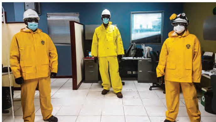
特立尼达团队员工在Atlas工厂检修期间的照片